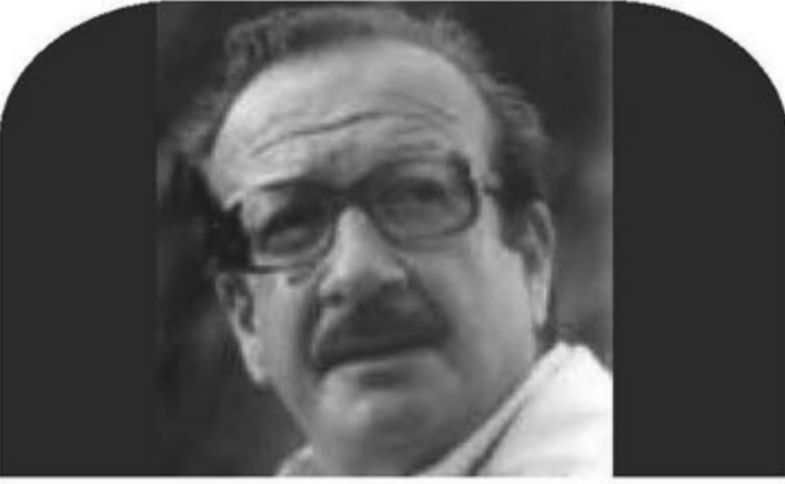
Mahmut Tali ÖNGÖREN 1931 – 1999