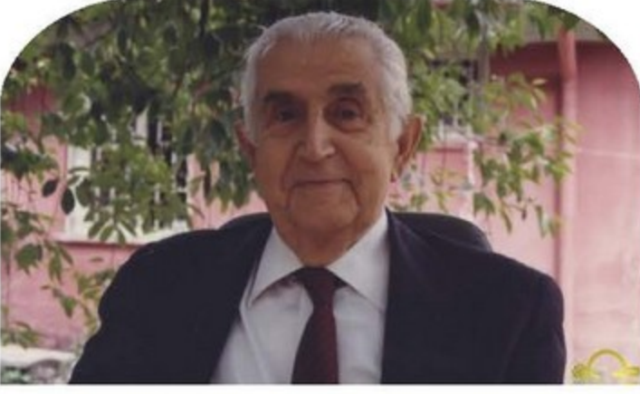
Dr. Nusret FİŞEK 1914 – 1990