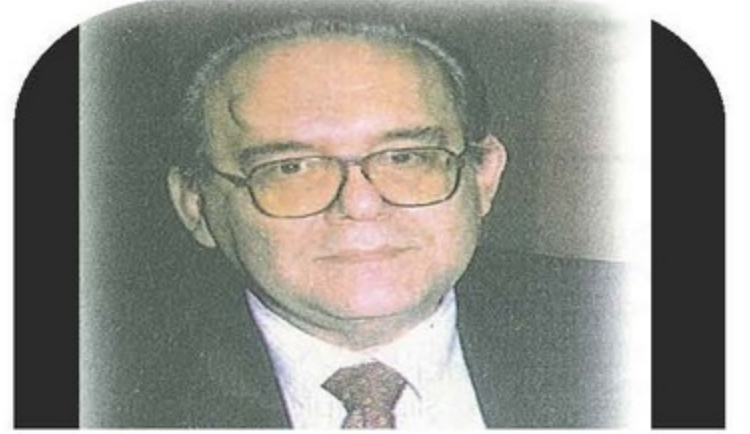
Ergin ATASÜ 1940 – 1998