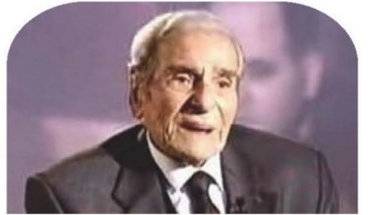
HALİT ÇELENK 1924–2011