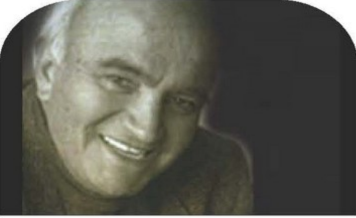
Mustafa EKMEKÇİ 1924 – 1997