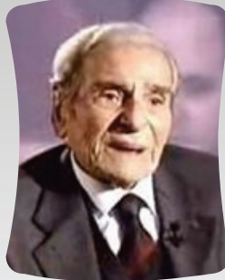
HALİT ÇELENK 1924 - 2011