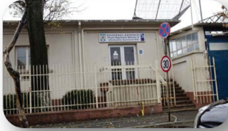
CİA Gizli Cezaevi - Romanya 25

Ayrıca bu yerlerin mutlaka resmi olarak belirlenmiş alıkoyma yerleri olması da gerekmez. Bu amaçla kullanılan ancak " gizli " yerler de izleme faaliyetinin kapsamı içindedir.